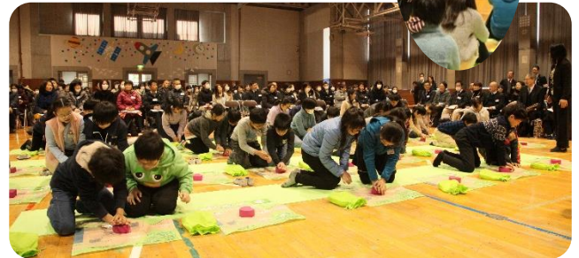
公開授業の様子 (昨年度)